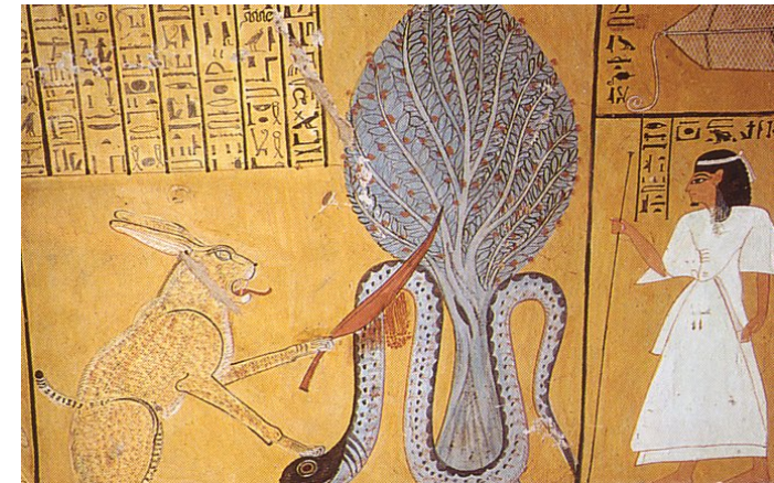
Grab des Inkerkhou, in Deir el Medine