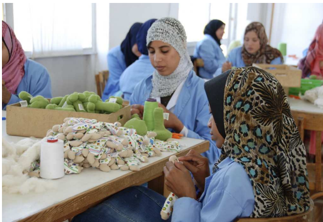
Püppchen nähen, SEKEM-Farm