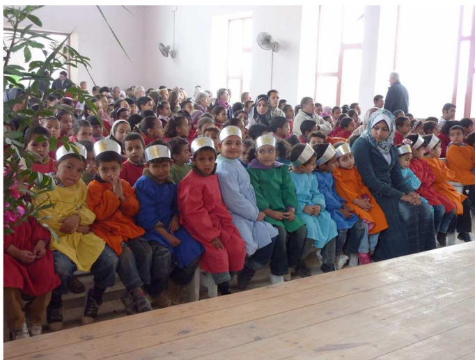
Schulfeier in SEKEM