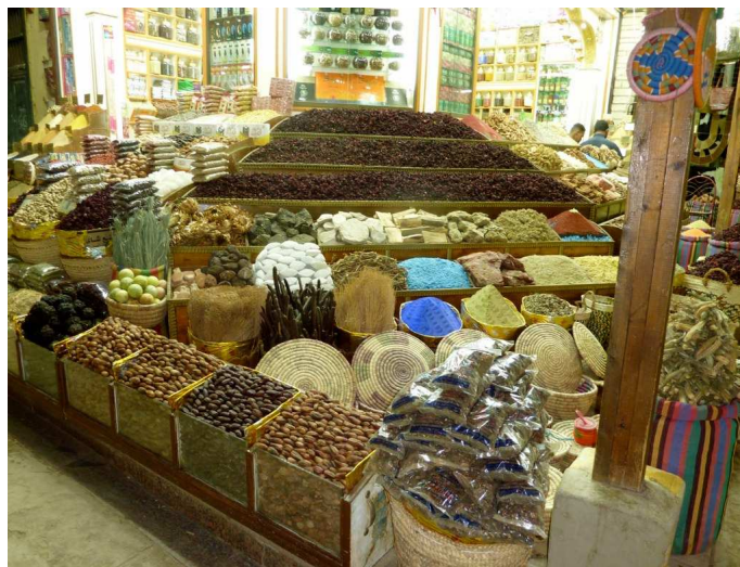
Gewürze auf dem Basar in Assuan