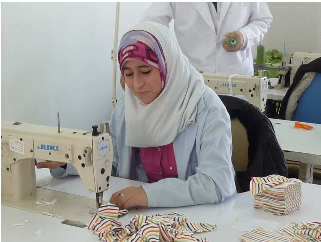
Eine Arbeiterin in SEKEM