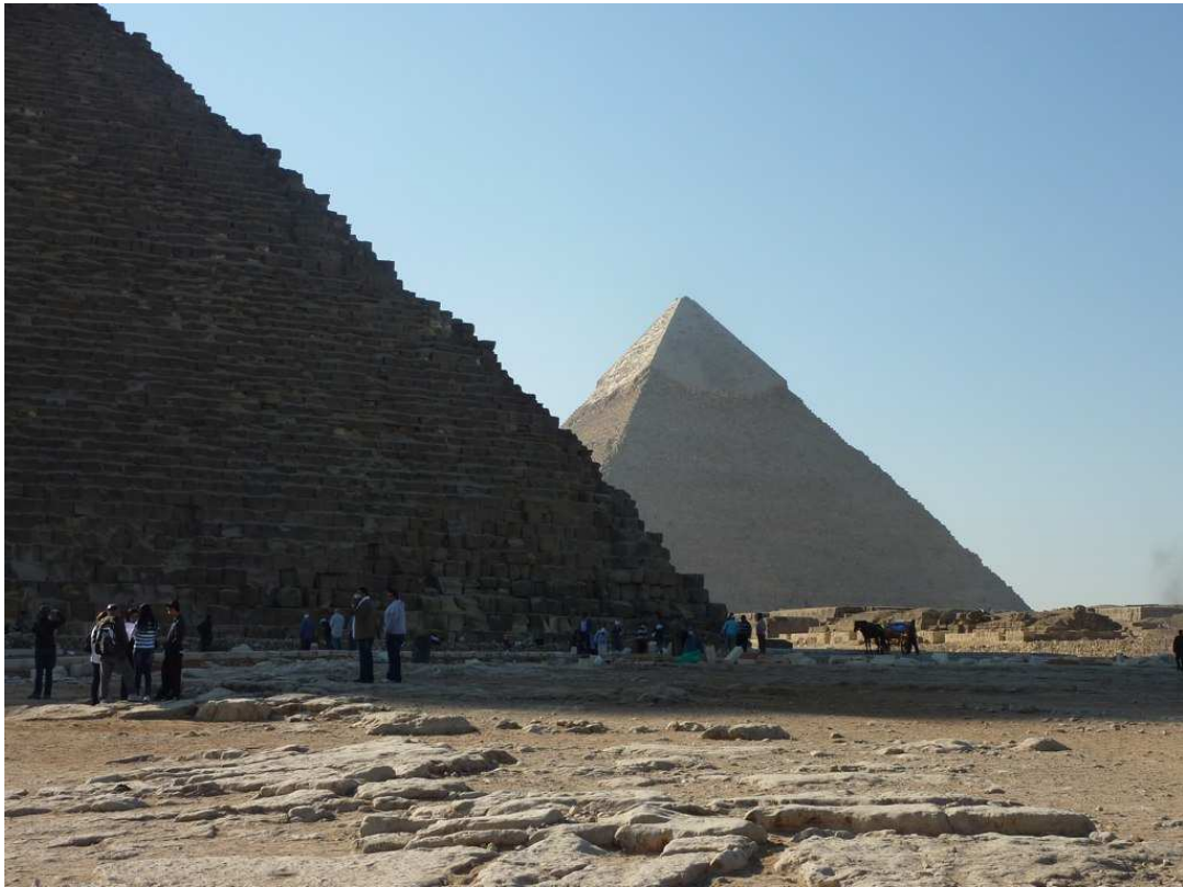
DIE Pyramiden in Gizeh