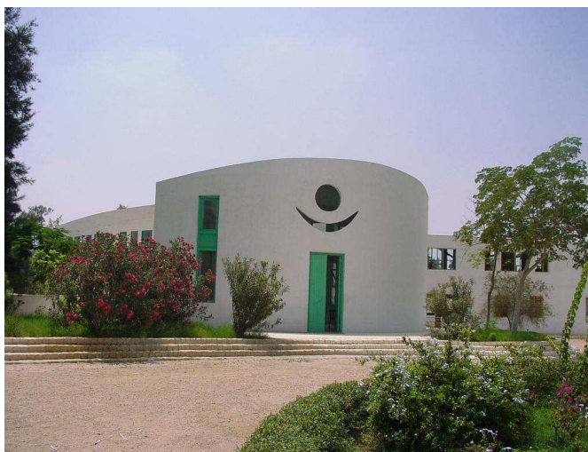
Moschee - Gelände der SEKEM-Farm