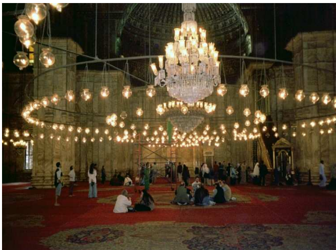
Kandelaber in der Alabaster-Moschee