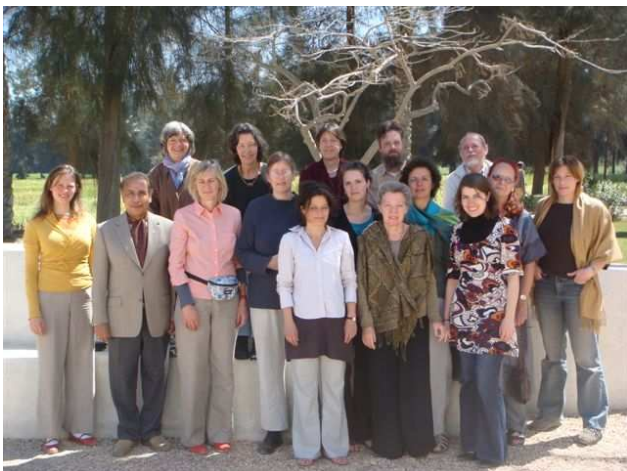
Islamseminar März 2008

islamische Viertel nach Kairo geplant mit dem Schwerpunkt auf der Besichtigung der alten Moscheen.